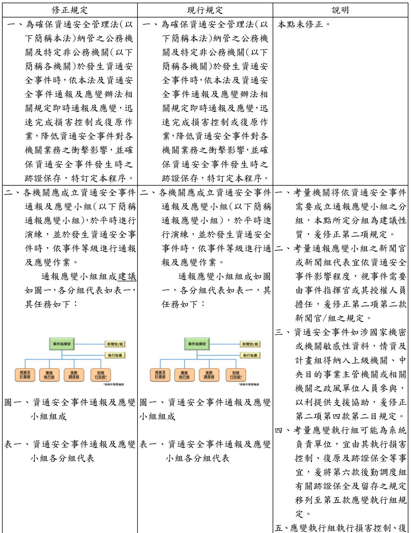
圖一、資通安全事件通報及應變小組組成