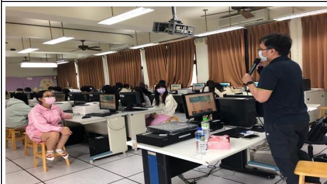
針對學生遇到之操作問題做講解