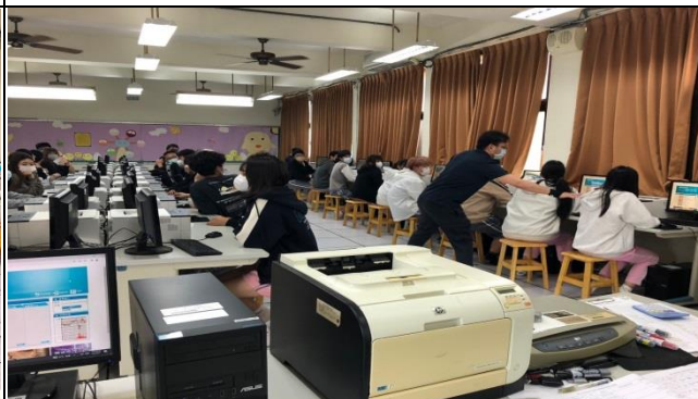
講師親自指導學生操作系統