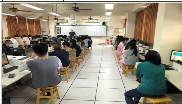
校內教師及學生專心聆聽課程內容