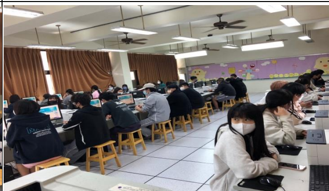
學生仔細聽取軟體操作技巧