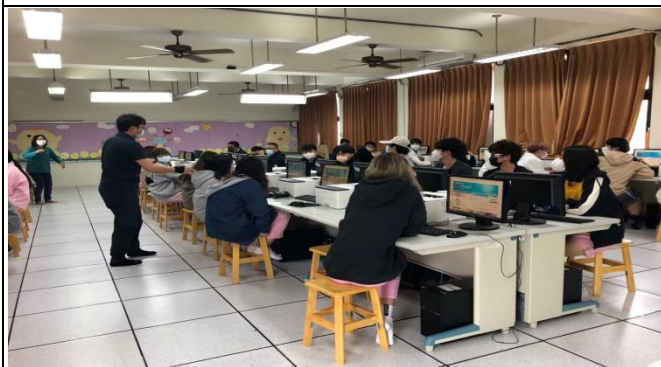
學生向講師提出問題詢問