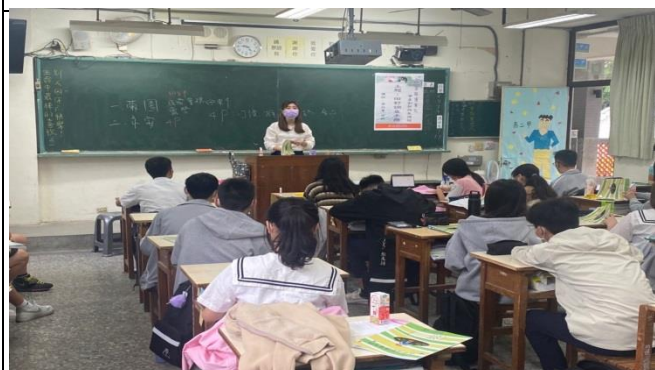
老師請同學研讀講義內容(商二甲)