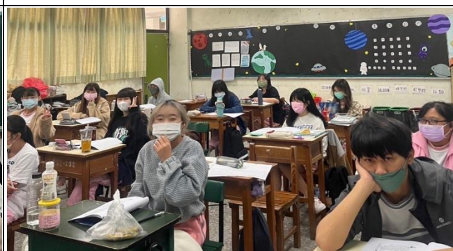
學生聆聽老師講解(貿二甲)