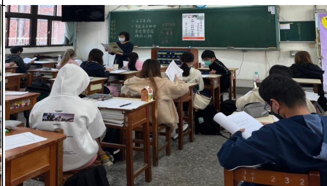
老師帶領學生研讀課程講義(貿二甲)