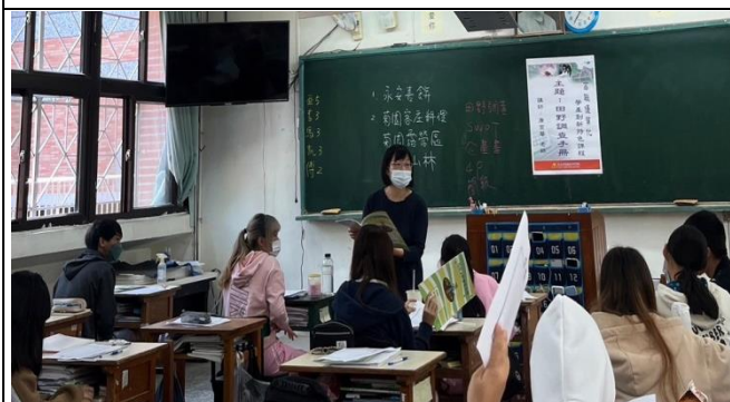
老師解說課程內容(貿二甲)