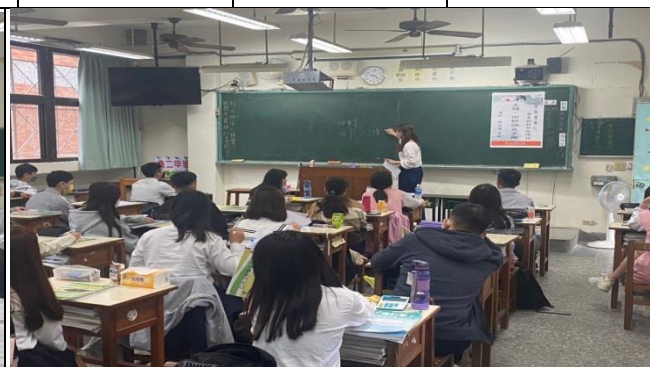
教師將重點條列於黑板上(商二甲)