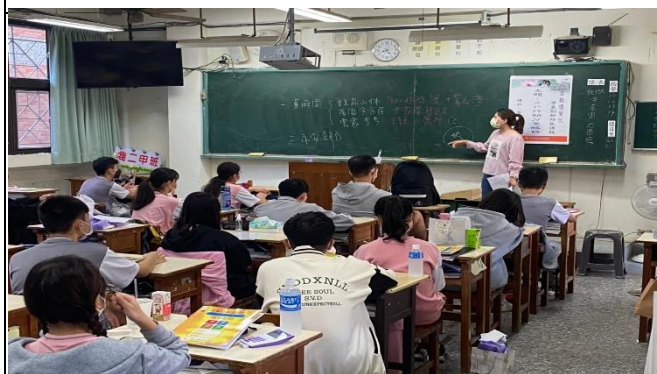
教師詳細解說 4P 行銷策略(商二甲)