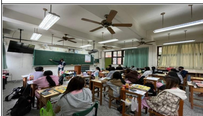
學生仔細聆聽 4P 行銷策略(貿二甲)