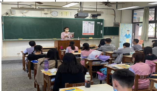
學生與老師一同研讀 4P 講義(商二甲)