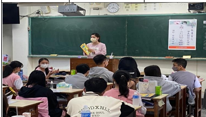
教師對 4P 講義之說明(商二甲)