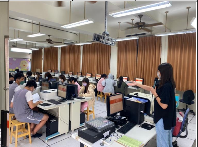
教師請學生一起研讀課程講義