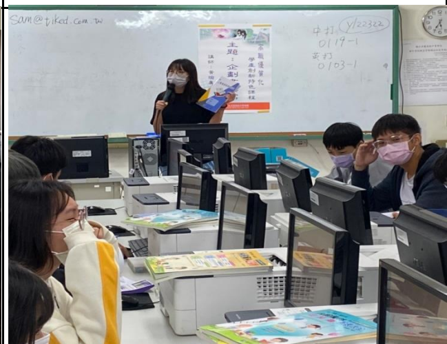
教師解說講義內容