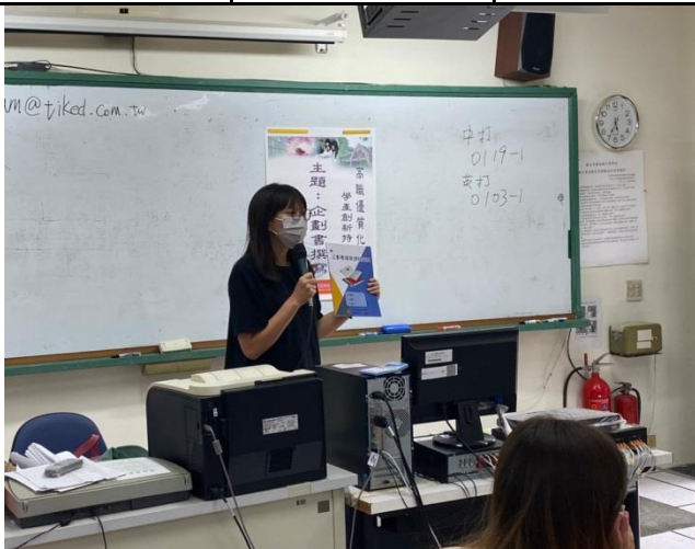
教師說明企畫書內容