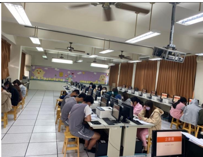
小組討論相關課程內容