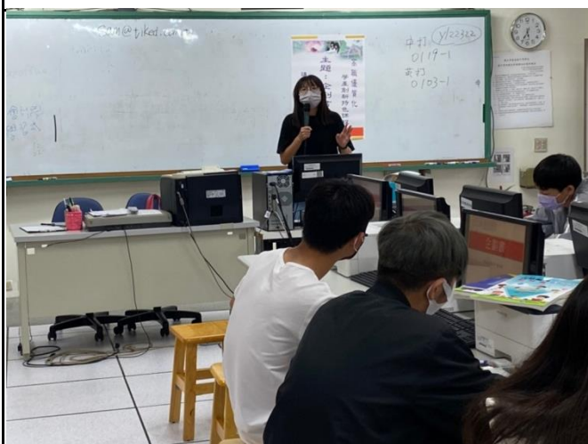
學生仔細聆聽教師課程內容