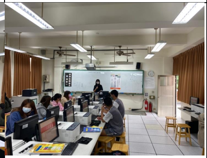
教師針對學生問題做講解