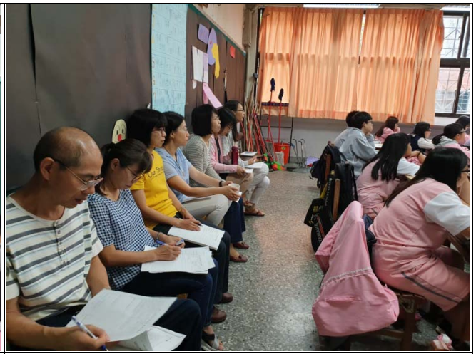
老師們很認真在觀課及做紀錄