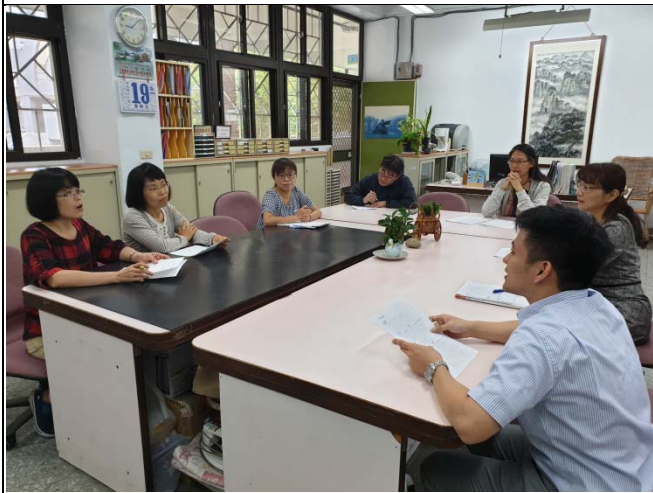
老師們給予被觀課教師回饋