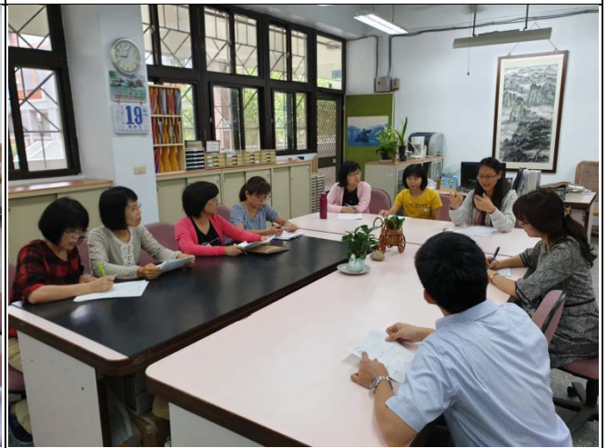
老師們給予被觀課教師回饋