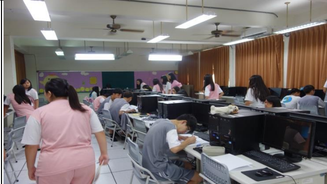
4P 行銷策略同學上課研讀與討論