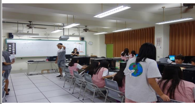
4P 行銷策略同學上課研讀與討論