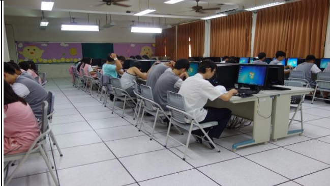
4P 行銷策略學生上課情況