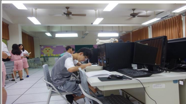
4P 行銷策略同學上課研讀與討論