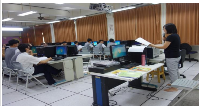
4P 行銷策略老師上課情形