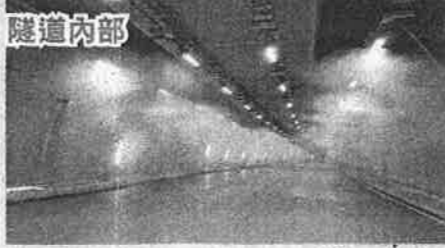
上圖：蘇花改工程進入尾聲，仁水隧道配合隧道機電、交控工程併行日夜施工，圖為隧道內水霧自動系統。（資料照）