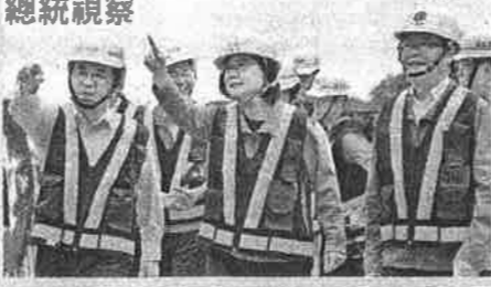
上圖：蘇花改共有3路段，蘇澳—東澳段去年已通車。（資料照） 下圖：總統蔡英文昨早到花蓮縣境內仁水隧道南口關心工程進度。（記者王峻祺攝）