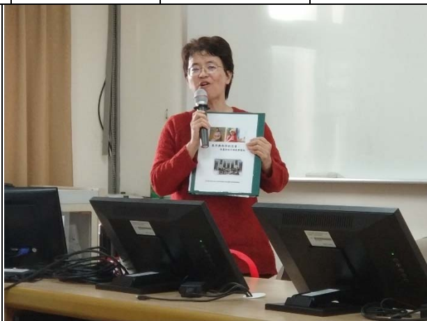
講師展示教學檔案