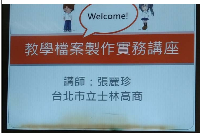
教學檔案製作研習活動通知