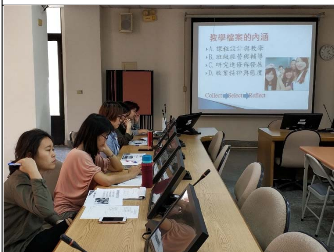
教學檔案內涵介紹