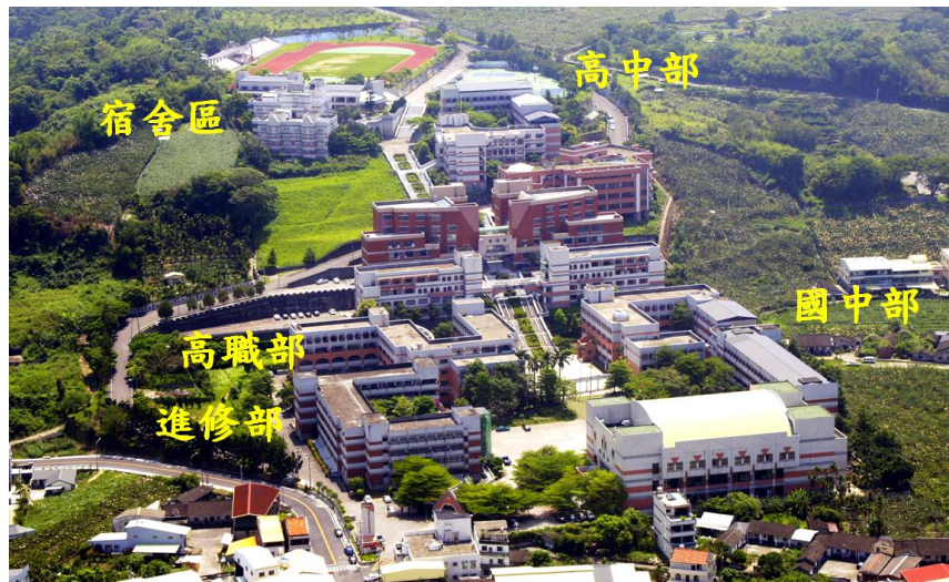
校園平面配置圖 School Building Layout Diagram

本校幅員廣大，佔地 7.98 公頃，沿山坡而建，高低落差 60 公尺，校舍主要分為高中部、高職部、進修部、國中部、圖書館、行政區、及宿舍區等。