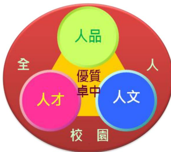
圖 1 學校願景圖

人文素養是人身而為人所應具備的存在條件，我們能從人的本質出發，去同情理解、去關懷了解人類活動背後的本質意義，並進而使人類的生活過的更好，藉以提升學生之人文素養，重視多元文化、多元性別等議題，開拓學生之國際視野、藝術涵養、生活品味等面向，達全人教育之理想。